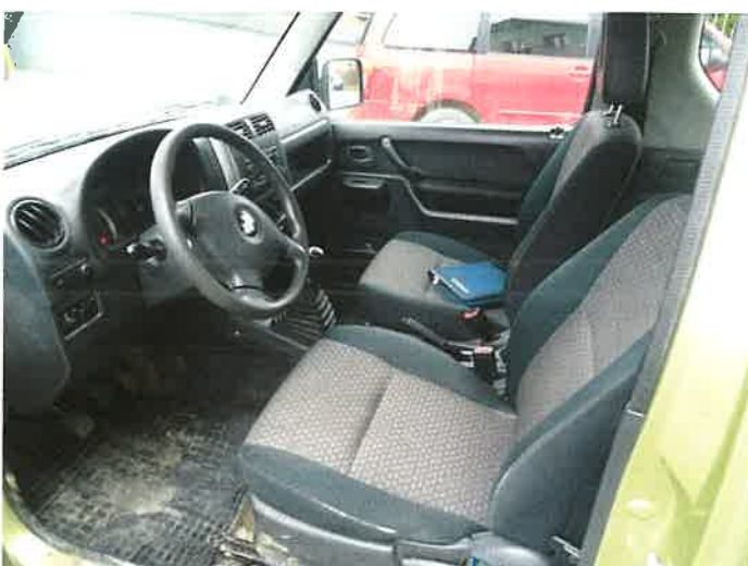
WNĘTRZE - FOTEL KIEROWCY

RZECZOZNAWCA MARIUSZ CIEŚLA Uprawnienie nr 0003/07/PCA tel. 691-663-388 email: ciesla@mariusz@wp.pl