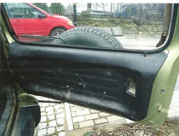
WNĘTRZE DRZWI TYLNYCH

RZECZOZNAWCA MARIUSZ CIEŚLA Uprawnienie nr 0003/07/PCA tel. 691-663-305 email: ciesla@mariuszciepla.pl