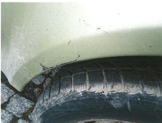
BŁOTNIK PRAWY TYLNY