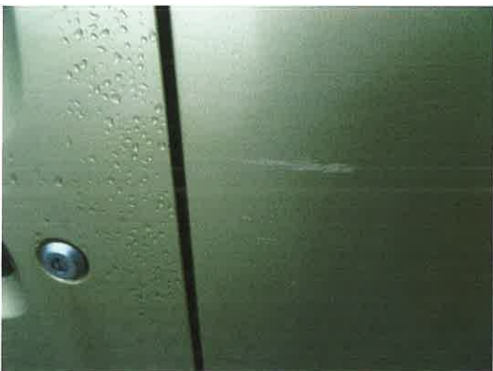
BŁOTNIK LEWY TYLNY