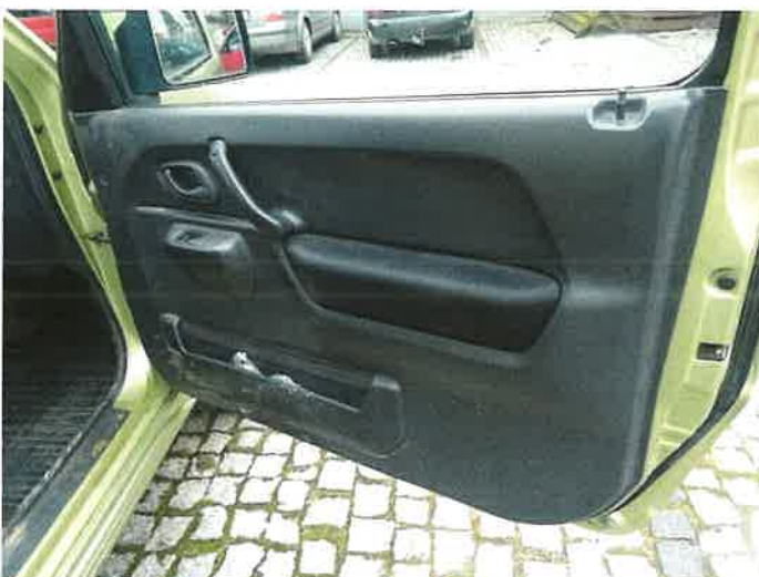
WNĘTRZE DRZWI PRAWYCH

RZECZOZNAWCA MARIUSZ CIEŚLA Uprawnienie nr 0003/7/PCA tel. 691-653-385 email: cieslamariusz@wp.pl 12-03-2024