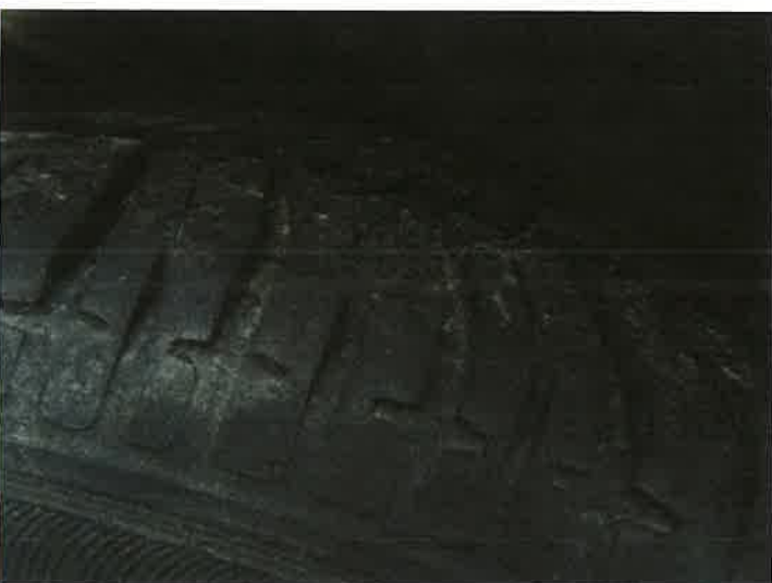
WIDOK RZEŻBY BIERZNIKA

RZECZOZNAWCA MARIUSZ CIEŚLA Uprawnienie nr 0003/07/PCA tel. 691-668-180 email: cieclamariusz@wp.pl