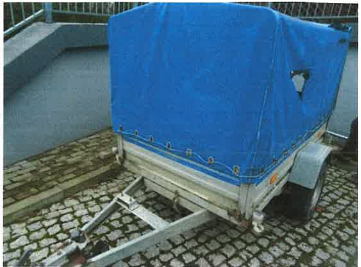
PRZÓD I LEWY BOK