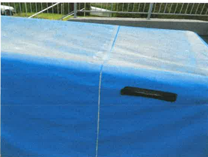
WIDOK GÓRNEJCZEŚCI PRZYCZEPY