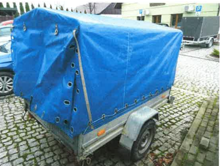
PRAWY BOK I TYŁ