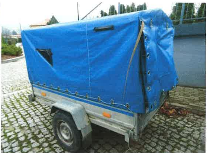
LEWY BOK I TYŁ